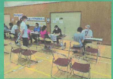
教員によるフィードバック