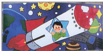
左：桜橋（2007年） 上：宇宙橋（2022年）